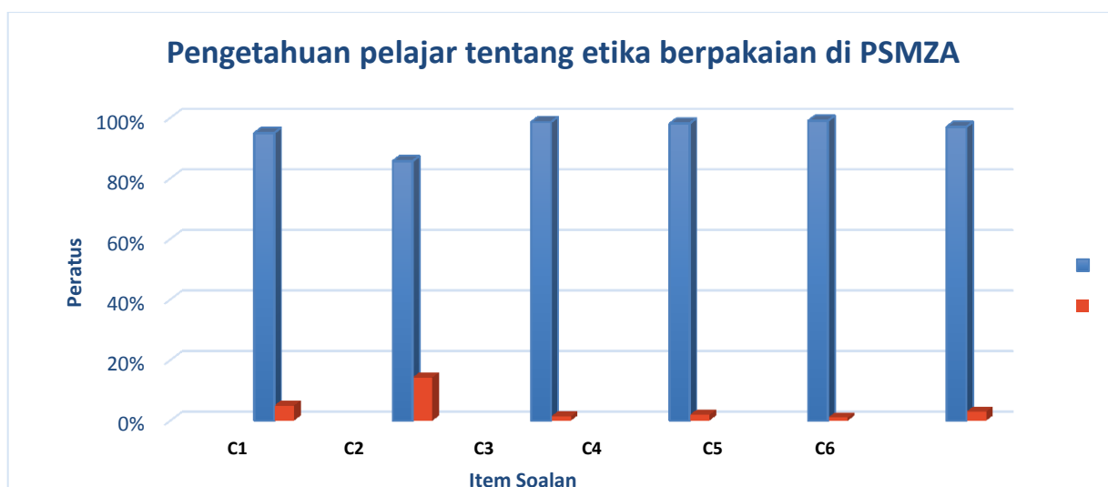
Rajah 1: Pengetahuan pelajar tentang etika berpakaian di PSMZA